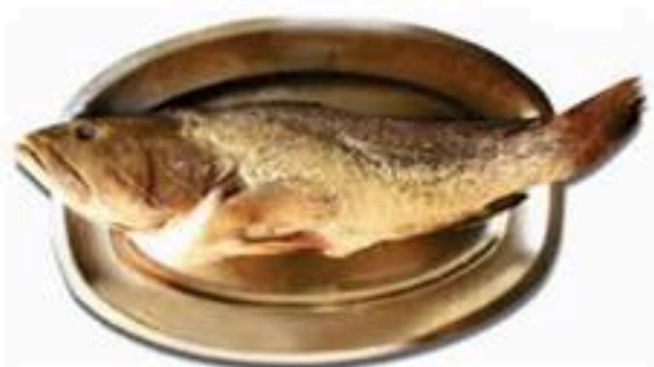
Asprovlahos Ασπροβλαχος Ασπροβлахос