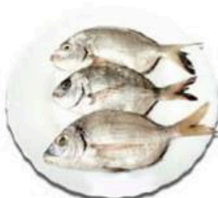
Sorkoi Σορκοί Сорки