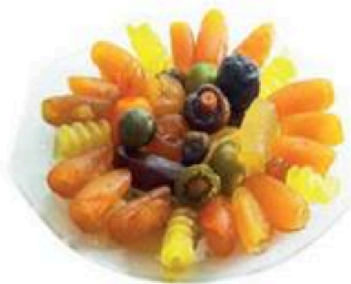
Cyprus Sweets • Γλυκά του Κουταλιού