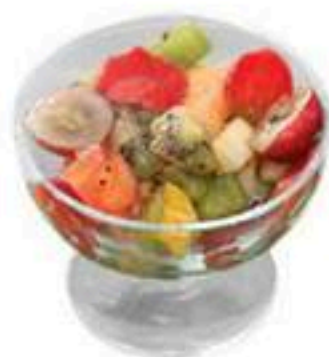
Fruit salad (1 person) Φρουτοσαλάτα (1 άτομο) Фруктовый салат (на 1 персону)