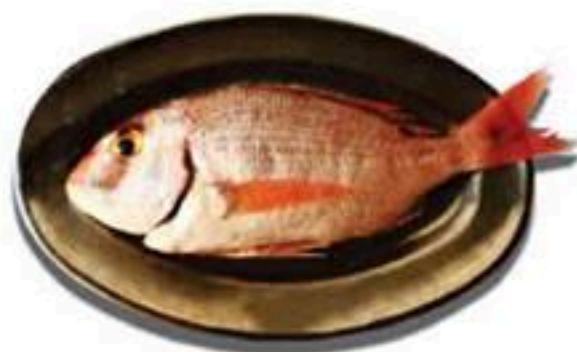
Fangri Φαγγρί Φангри