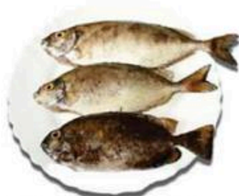
Kourkounes Κουρκουνες Куркунес