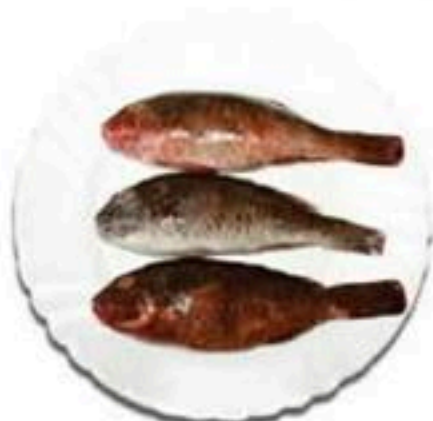
Skaroi Σκάροι Скари