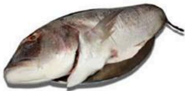
Sinagrida Συναγρίδα Синагрида